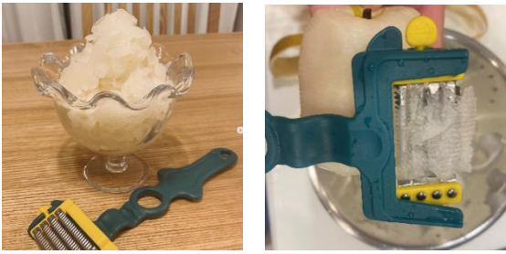
「部門賞(ユニーク賞準賞)」:まるごと梨のグラニテ