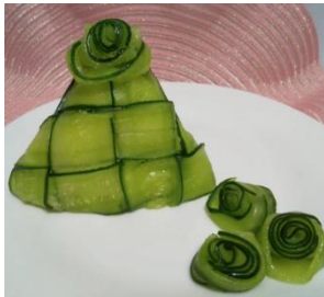
「部門賞(応用準賞)」:ヒラヒラきゅうりのおめかしおにぎり