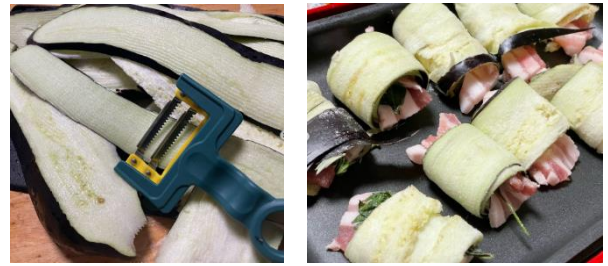
「部門賞(応用賞)」:豚バラの茄子巻き